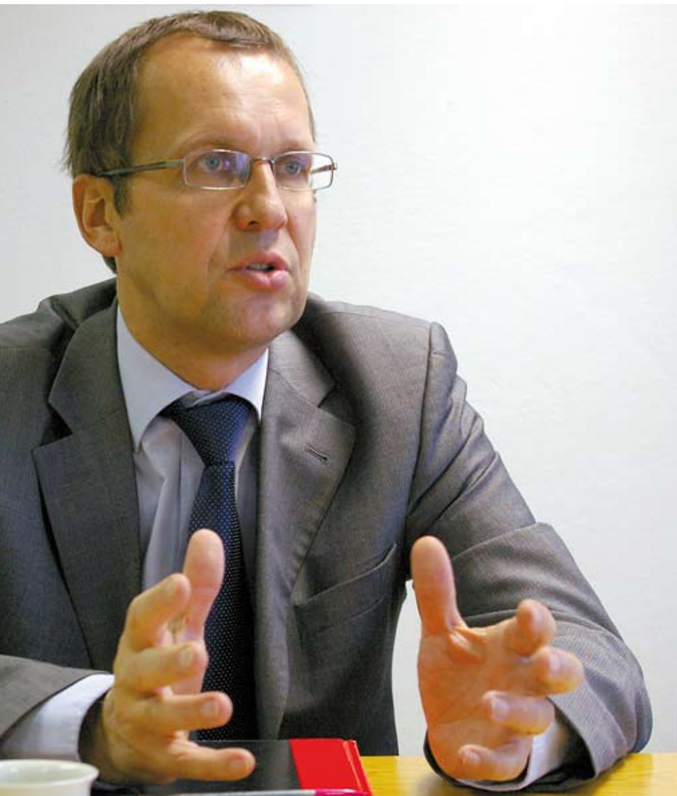
Kuvat: Connie Heik

Suuria määriä kasvihuonekaasuja voidaan vastaisuudessa varastoida hiekkakiveen, arvioi Bernd Holling.